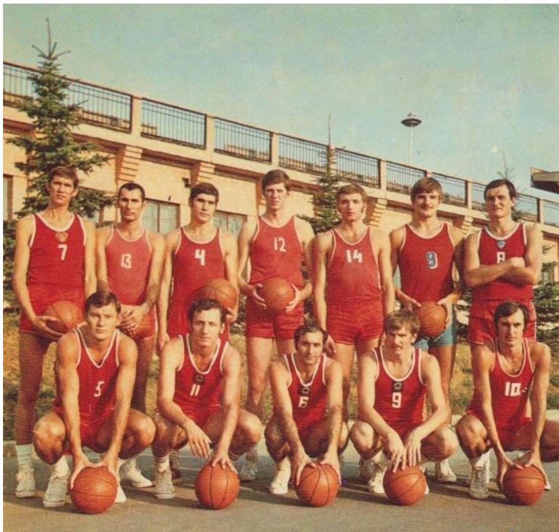
1972 年慕尼黑奥运会苏联篮球队队员合照

值得一提的是，最近热播的电影绝杀慕尼黑，原型就是 1972 年的慕尼黑奥运会，苏联男篮在决赛中上演了 3 秒绝杀的好戏。