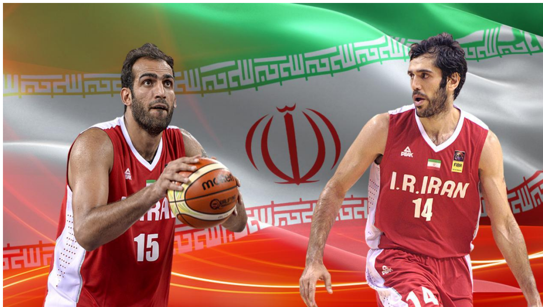
巴赫拉米：昔日亚洲第一小前锋

当然，哈达迪也有着不足之处，致命弱点就是移动速度太慢，加上已经 34 岁，体能上已经不足以支撑哈达迪打满全场，使用率上在俱乐部比赛已经呈现下滑的趋势，哈达迪已经不是那个大包大揽的超级内线。