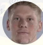
20-德尔布里奇 (3-金光奭)